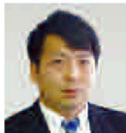
(株)久慈設計 東京支社 BIM推進室 室長