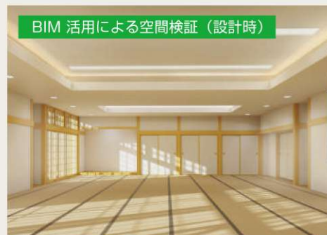
BIM活用による空間検証（設計時）

多岐に渡るご要望や問題を解決するために、BIMを活用して改修設計を行い業務の効率化を図りました。BIMを用いて視覚化を行い、早期に問題を発見し問題解決方法を具体的に提示することで意見の統一を図り、お客様のご要望を最大限に具現化することを目指しました。