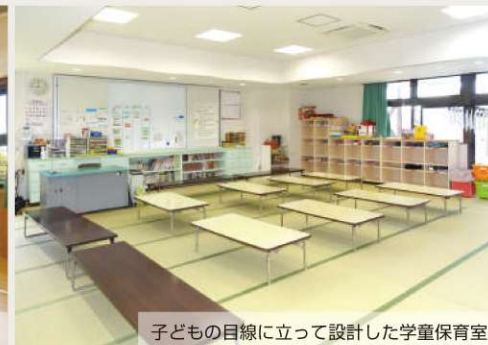
子どもの目線に立って設計した学童保育室