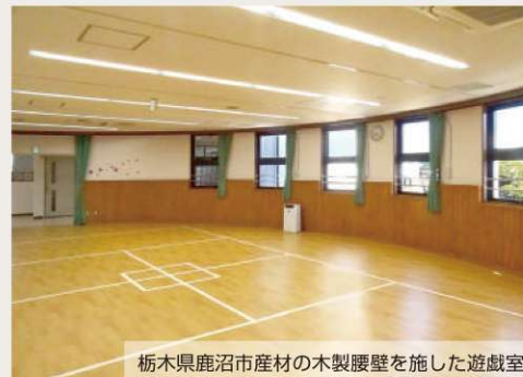
栃木県鹿沼市産材の木製腰壁を施した遊戯室

本施設は、人と人との交流を深め、区民の笑顔を増やし、活気あるまちづくりを進める拠点として今後さらに活躍が期待されます。