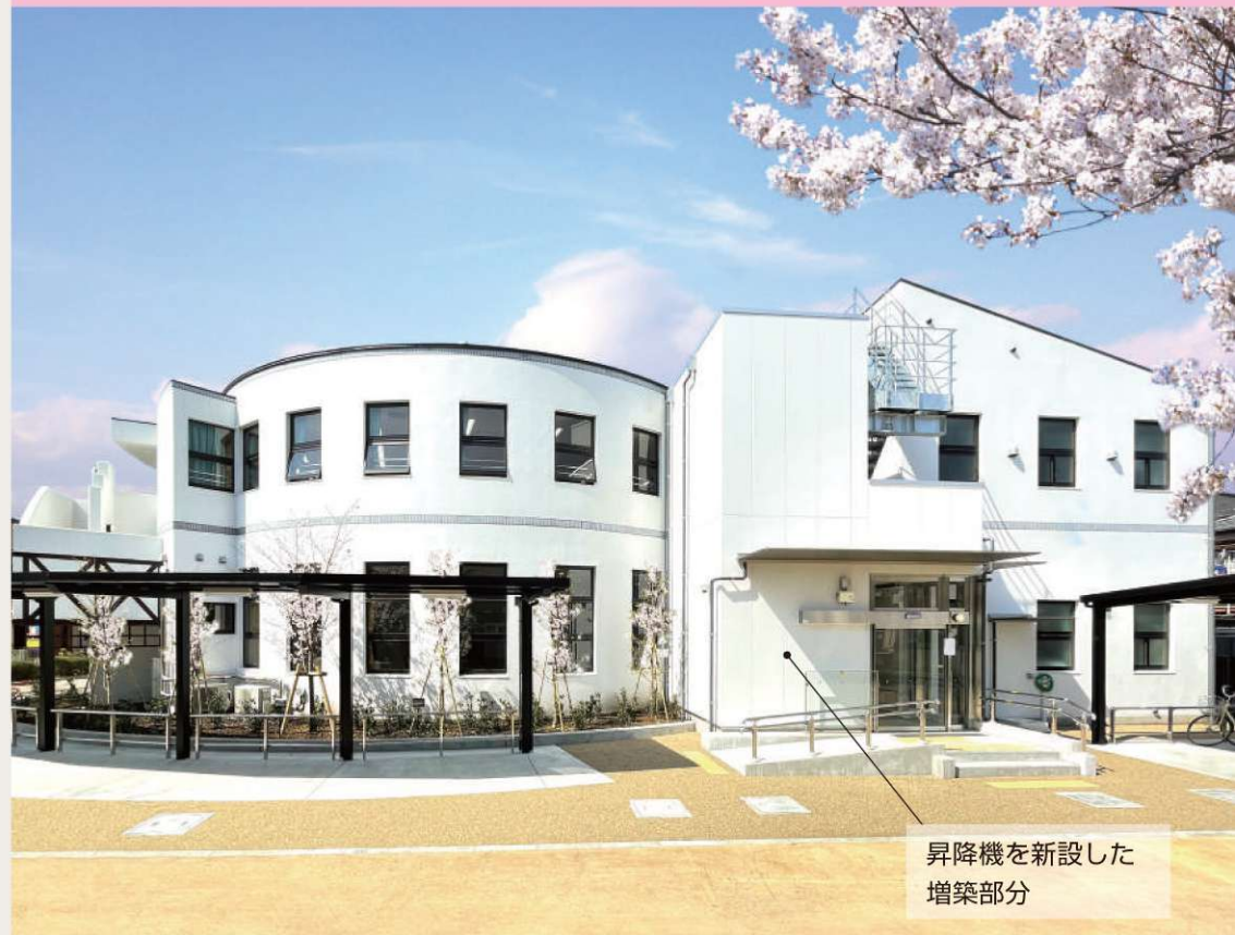
昇降機を新設した 増築部分

KUJI HIGASHINOH ARCHITECTS STUDIO 株式会社 久慈設計東日本 (一級建築士事務所)