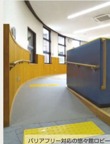
バリアフリー対応の悠々館ロビー

また、足立区公共施設等整備基準に則するユニバーサルデザインを取り入れ、バリアフリーに配慮すると共に、利用時の騒音や振動に配慮した床材の採用、収納力や利便性に優れた造作家具を多く新設し、誰もが利用しやすく居心地の良い空間づくりを目指しました。