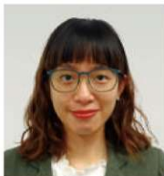
(株)久慈設計 東京支社 BIM推進室 ナショナルエンジニア