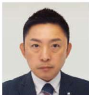
(株)久慈設計 取締役 副社長